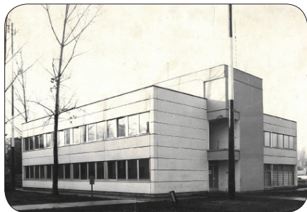
Az átadott hírközpont homlokzata a főbejárat felől

Az említett három meghatározó koncepció, valamint a híradó szolgálat belső fejlesztési és had-