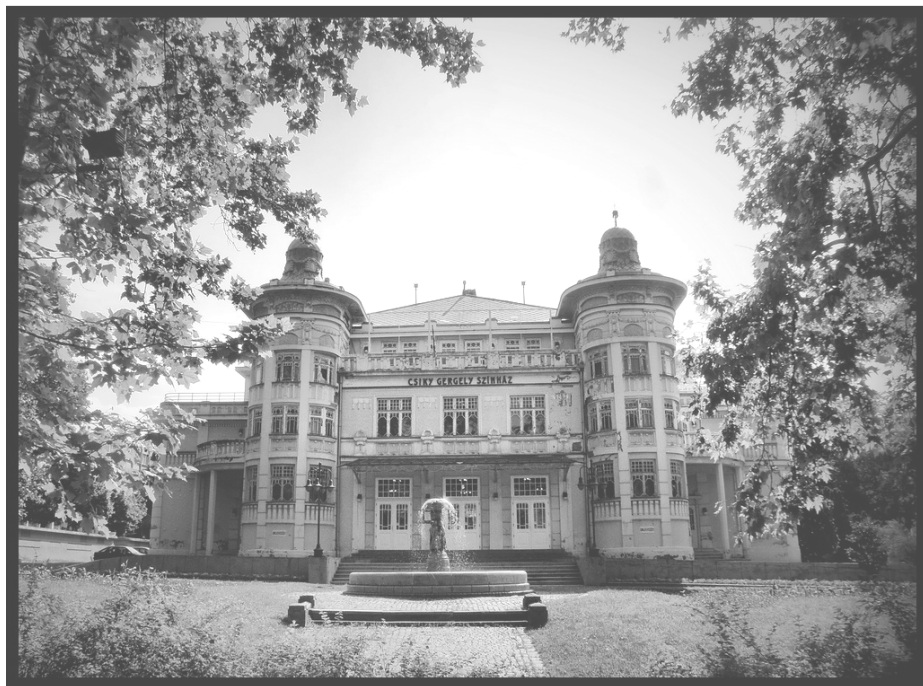
A városi Csiky Gergely Színház

Tudtam, hogy egyszer valamikor visszatérek Szentgyörgyvölgyre, ahová súlyos idők gyermekkori emlékei fűznek. Tulajdonképpen véletlenül került sor erre az emlékeket idéző látogatásra, mert barátaimmal egy örségi túrára mentem és a gyönyörű tájon kocsikázva