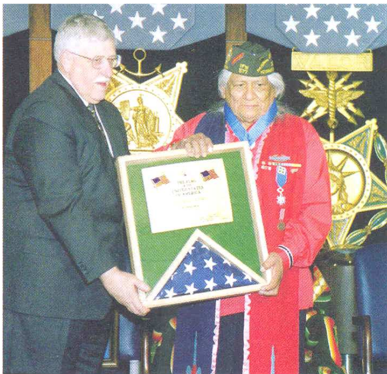
A 78 éves Charles Chibitty, az utolsó élő comanche kódmondó elismerést vesz át a Pentagonban

Az „a” betű példája szerint a legtöbb betűnek egynél több navajo megfelelője volt, de nem kellett minden szót betűről betűre kódolni. A kódrendszer kifejlesztői 450 gyakran előforduló katonai szakszót