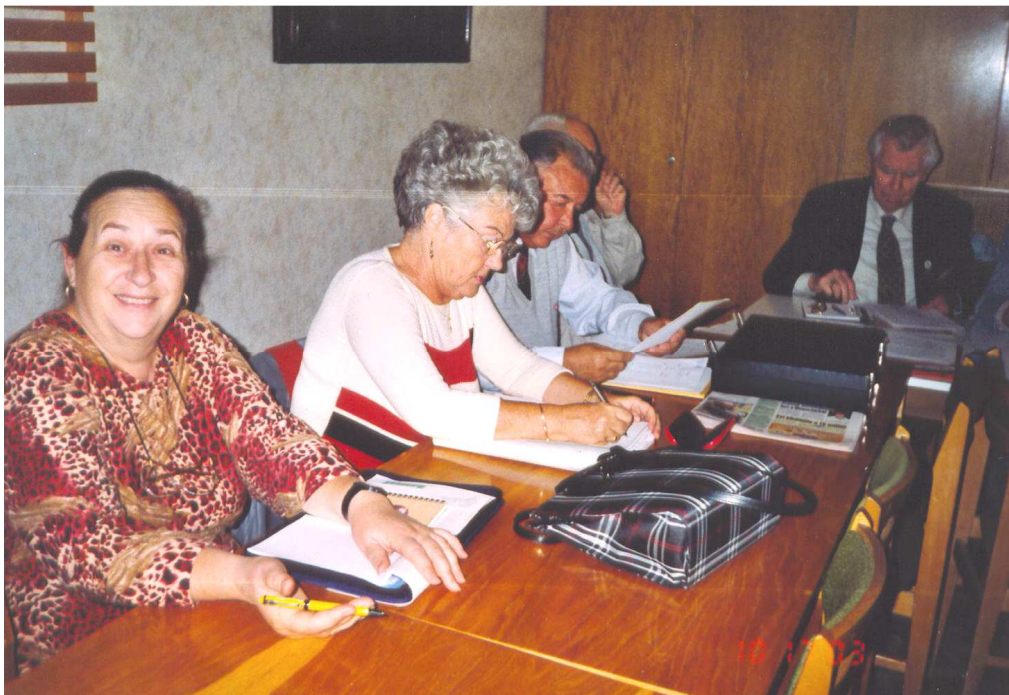
a Puskás Tivadar Híradó Bajtársi Egyesület elnökségi ülése