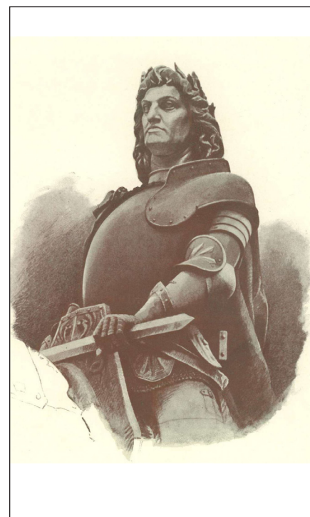
Mátyás király: A kolozsvári Mátyás-szobor főalakja Fadrusz Jánostól