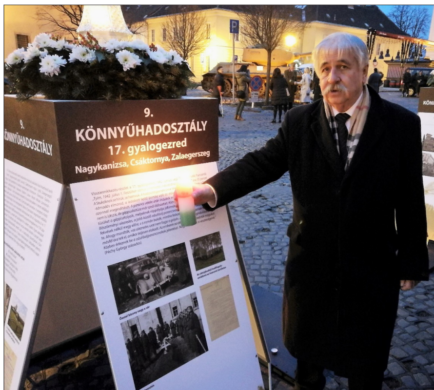
A hősi halott zalai katonákra gondolva a helyőrségi-emlékpontnál