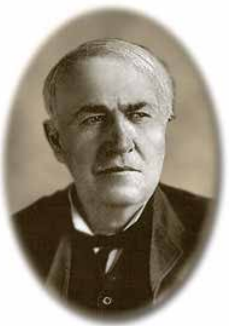
Thomas Alva Edison (1847-1931)