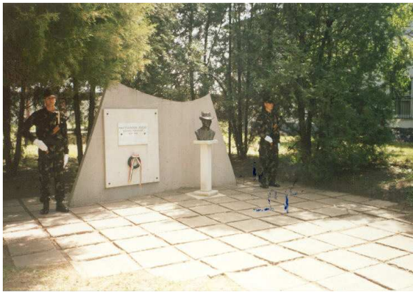
Nagysándor József emlékhely (székesfehérvári híradó laktanya)