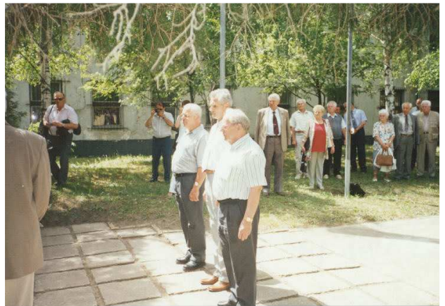
Nagysándor József szobrának megkoszorúzása

A megemlékezés koszorúját helyeztük el a névadó, Nagysándor József szobránál, majd az emlékszoba megtekintésére került sor. Közös ebéddel, baráti beszélgetéssel a múlt emlékeinek felidézésével fejeződött be e jó hangulatú találkozó.