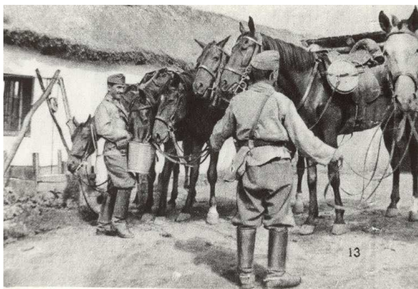
Itatás a híradóknál

Amióta megjelent az élet a földön, azóta létezik a hírközlés. Mechanikus - értem alatta - fizikális vagy láthatatlan bioelektromos módon történik a jelek átvitele-átadása, azaz közlése a másik élőlényvel (sejtek).